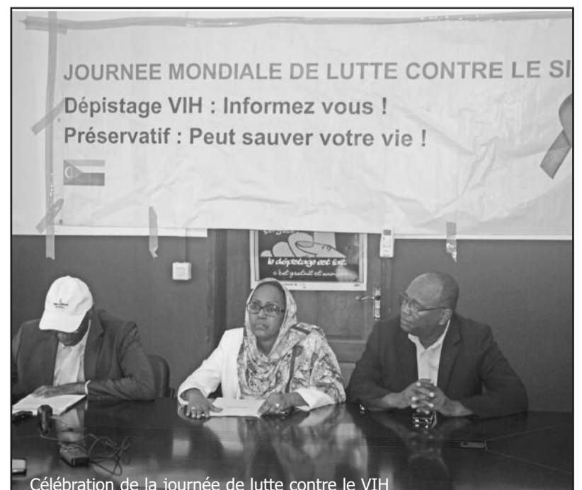
Célébration de la journée de lutte contre le VIH

Comité de Pilotage des Assises Nationales Immeuble Wadaane, Malouzini, Moroni Comores Tel. : 00269 763 53 17 contact@assisescomores.com