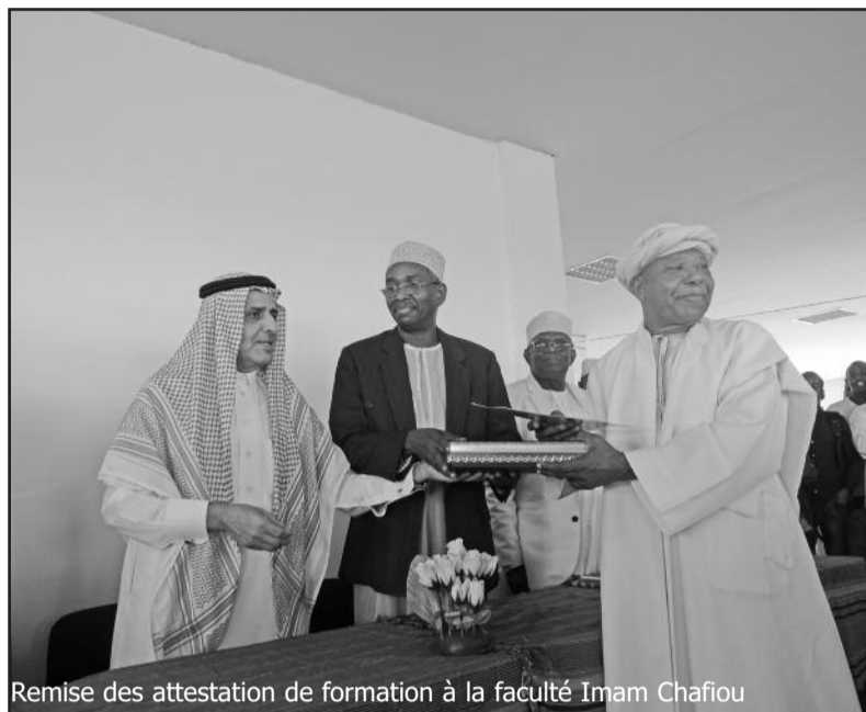
Remise des attestations de formation à la faculté Imam Chafiou

La délégation saoudienne comptait 15 personnes : 8 avaient la charge de la tenue de l'atelier, 2 étaient chargés des rencontres avec les étudiants et élèves qui veulent poursuivre leurs études en Arabe saoudite et