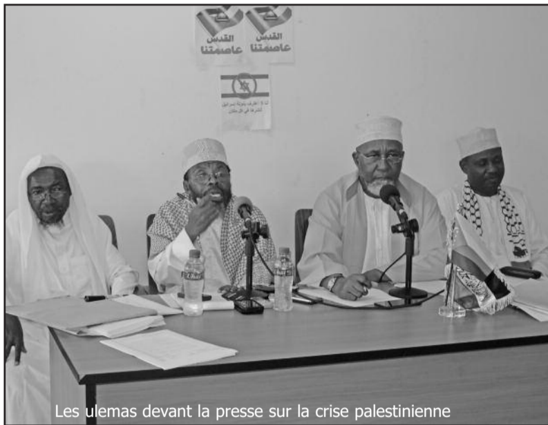
Les ulemas devant la presse sur la crise palestinienne

« La décision de reconnaître Jérusalem comme capitale d'Israël est un acte grave, conséquence de la politique suivie par les États Unis d'Amérique depuis des décennies, une violation du droit international et de la charte des Nations Unies, un appui à l'occupation illégale de la Ville Sainte », a déclaré