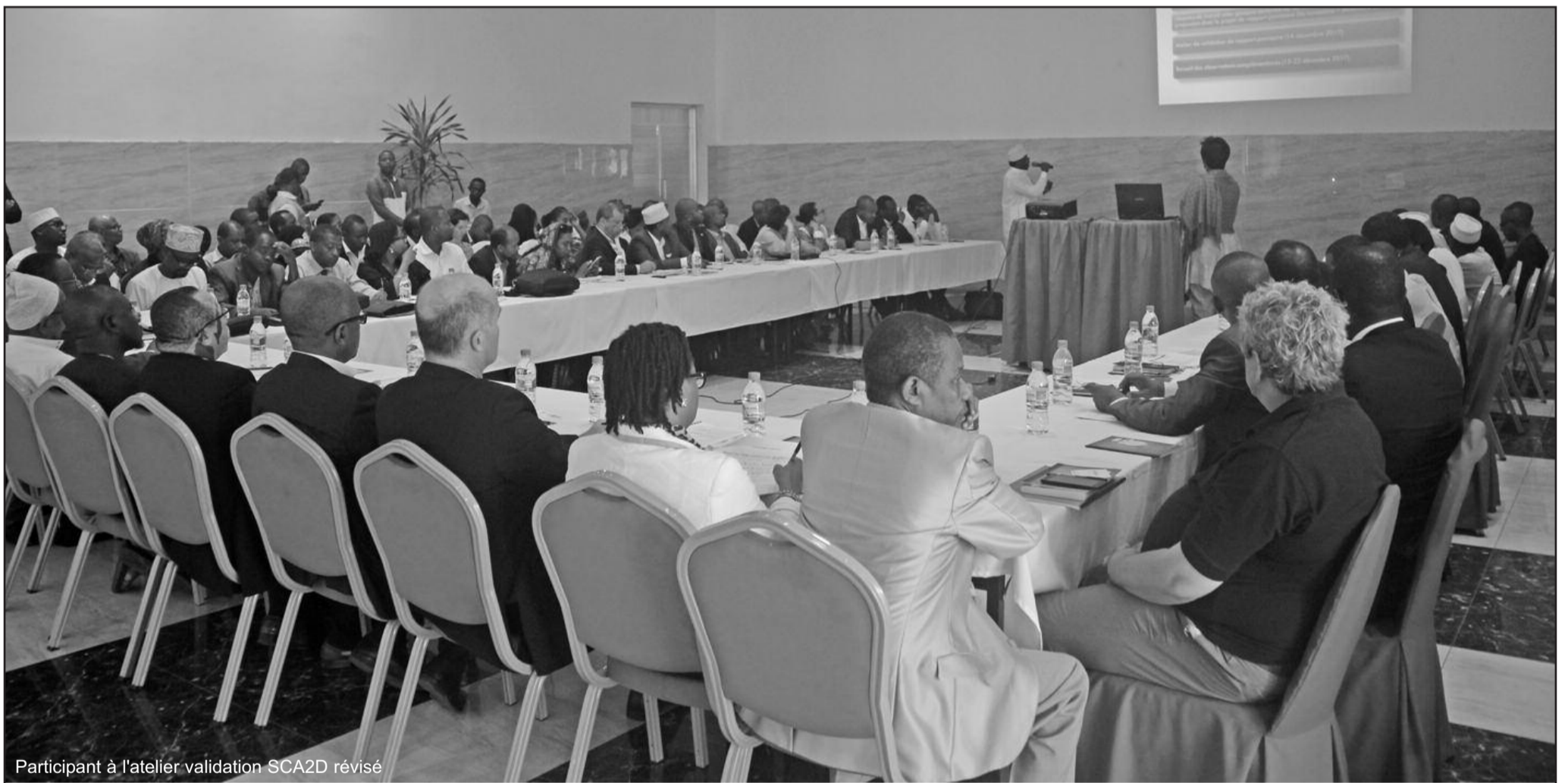
Participant à l'atelier validation SCA2D révisé